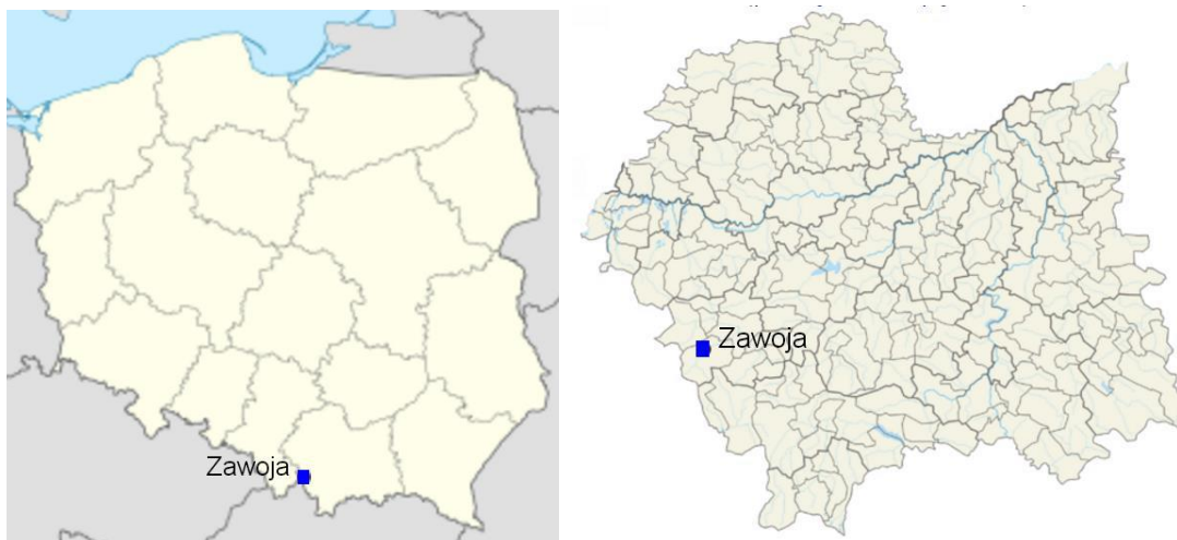
Rys. 1. Uwarunkowania lokalizacyjne

Zawoja jest gminą turystyczno - rolniczą, gdyż istnieją korzystne warunki do prowadzenia działalności turystycznej i produkcji rolnej.